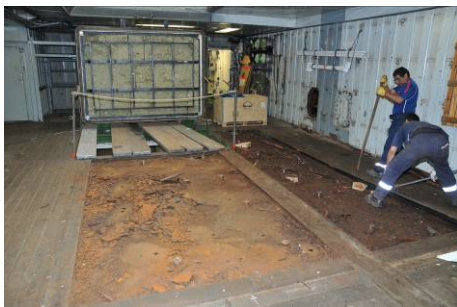
Austausch des Holzbodens WS 2