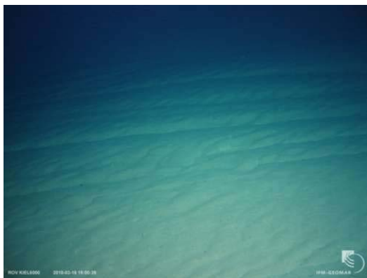
c) Störungen am Meeresboden, die Strömungsrippeln durchschneiden, gehen stufenartig den Hang zum Beata-Rücken hinauf (Ansicht hangaufwärts).