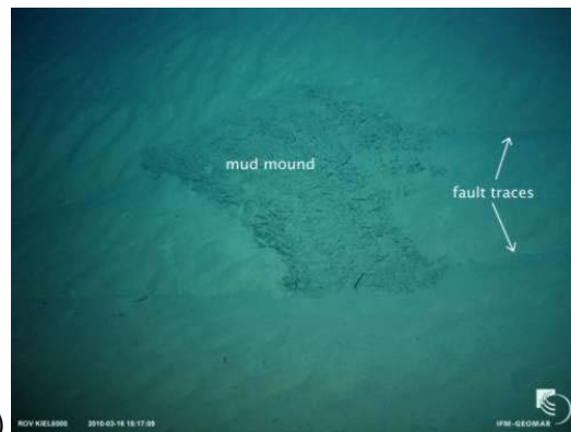
d) Kleiner aktiver Schlammhügel (mud mound) auf einer Störung (fault) aufsitzend.