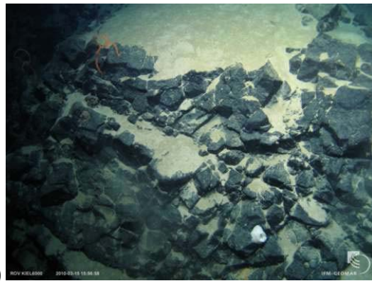
b) Klassische säulige Absonderung in basaltischer Lava als Folge der Kontraktion bei der Abkühlung.