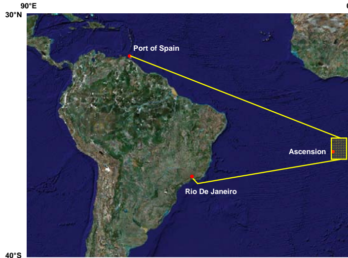
Abb. 1 Fahrtroute M78/2 mit dem Arbeitsgebiet bei Ascension Island. (Karte: Google earth)

Auch in dieser Woche der am 02.04. in Port of Spain (Trinidad) begonnen Reise war FS Meteor auf dem Transit zu den Arbeitsgebieten (Abb. 1) am Mittelatlantischen Rücken (MAR). Dank deutlicher Abnahme von Strömung und Wind gegenan und ruhiger See konnte die Reisegeschwindigkeit erheblich erhöht werden; wir erwarten so mit Spannung die erste Station bei den aktiven Hydrothermalsystemen am MAR für den frühen Morgen des 15.04. Die jetzt ausgezeichneten Bedingungen sind sicherlich dem Wohlwollen der Meereshüter zuzuschreiben, das wir sicherlich durch die Entscheidung, mit ausschließlich wohl getaufter Besatzung in die südliche Hemisphäre einzudringen, gewonnen haben. Nach einer entsprechenden Einstimmung der Täuflinge auf die anstehende Prozedur, begann die eigentliche Zeremonie am Karfreitag mit dem Tritonabend. Kurz nach der Querung des Äquators erschien dann Neptun mit Gefolge (Abb. 2) am Morgen des 11.04. an Bord, gefolgt von einer bis in den Nachmittag andauernden Taufe, bei der dem Anspruch aller 26 Täuflinge auf eine ziemliche Behandlung Genüge getan wurde. So waren dann bei der abschließenden Feier und Taufscheinübergabe ausschließlich strahlende Gesichter zu sehen. Dieses Ostern wird wohl allen eine bleibende schöne Erinnerung sein.