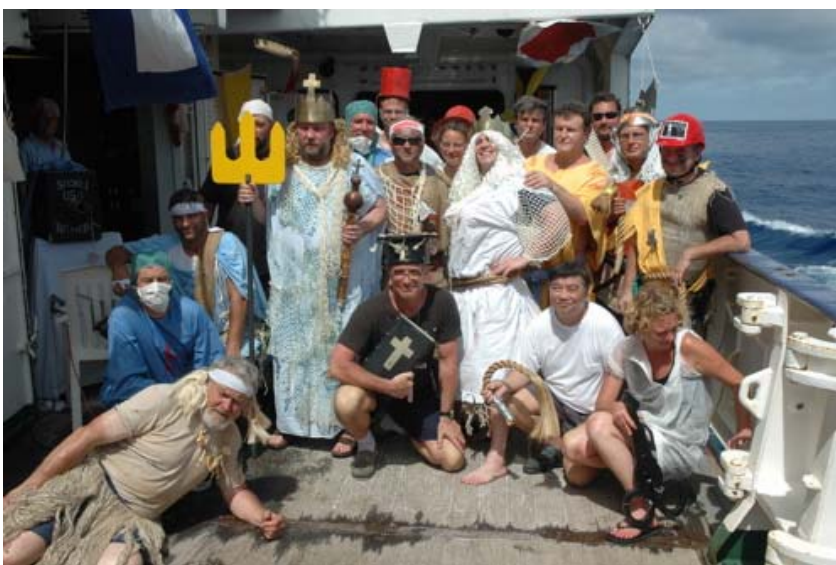
Abb. 1 Neptuns Gefolge nach getaner Arbeit. (Foto: K. Lackschewitz).

abschließenden Feier und Taufscheinübergabe ausschließlich strahlende Gesichter zu sehen. Dieses Ostern wird wohl allen eine bleibende schöne Erinnerung sein.