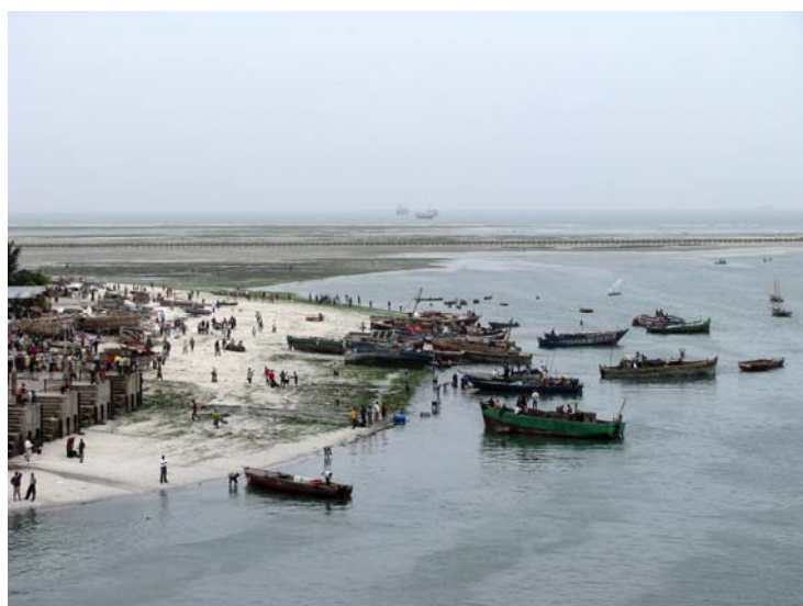
Eindruck beim Auslaufen von FS METEOR aus dem Hafen von Dar es Salaam, Tansania.