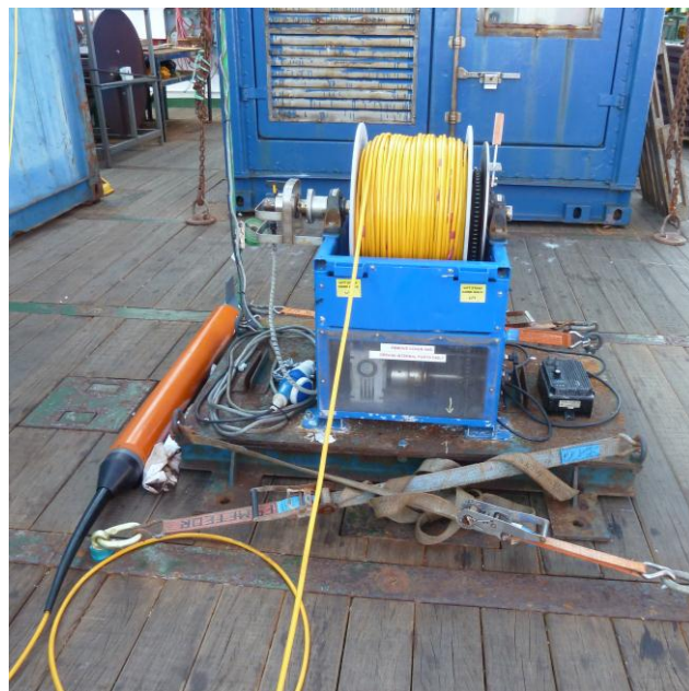
Abbildung 2: (Links) Lacoste & Romberg Seegravimeter zur Vermessung des Schwerfelds auf See, (Rechts) Seaspy-Magnetometer zur Vermessung des Magnetfelds auf See; beide Geräte wurden von den Britischen Projektpartnern aus Durham mitgebracht und betrieben.