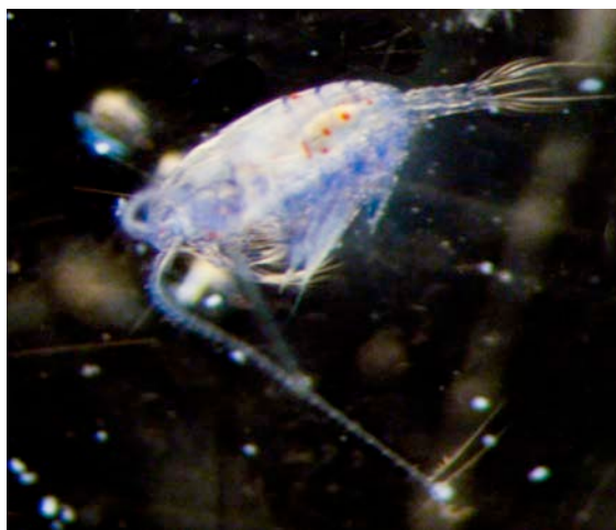
Der ‚Netzfang‘ enthält unterschiedlichstes Zooplankton. Nur eine Art, Undinula vulgaris , interessiert

Die Woche haben wir mit der weiteren Vermessung des Tracers und des Sauerstoffgehalts im Südostsektor des Messgebiets verbracht. Alle 4 Stunden stoppt die METEOR und wir nehmen ein CTD-Profil und Wasserproben. Und dann geht es zum nächsten Messpunkt in 30 nm Entfernung. Dienstag nahmen wir die erste driftende Sinkstofffalle wieder auf. Ohne Probleme kamen alle Sammelgefäße an Board und auf deren Boden konnten wir unterschiedliche Mengen von Sinkstoffen erkennen. Die Proben werden nun geteilt und gefiltert und für weitere Analysen in Kiel vorbereitet.