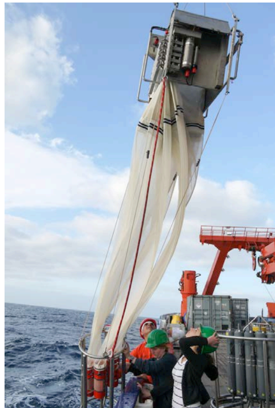
Das Multischließnetz wird ausgesetzt.

Mit einem Multischließnetz, einem Gerät, das fünf Planktonnetze in vorher bestimmten Tiefen schließen kann, wird die Verteilung von Zooplankton bis in Tiefen von 1000 m ermittelt. Das Multinetz kam vor allem in der ersten Woche bei der Erforschung des Eddies nördlich der