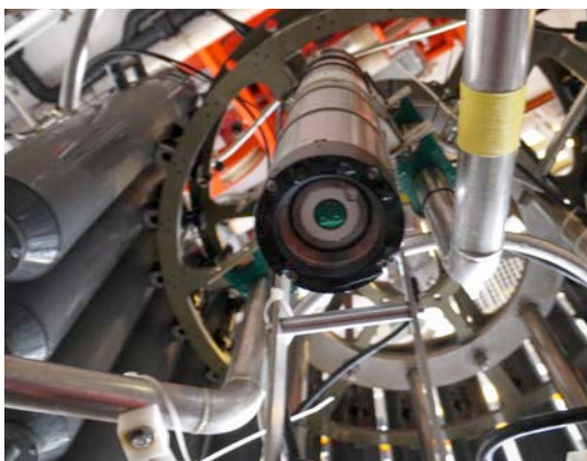
UVP-Kamera macht alle 6 Sekunden ein Bild von den Partikeln im Meer.

Ein weiteres Gerät zur Untersuchung von Zooplankton Verteilungen ist der UVP