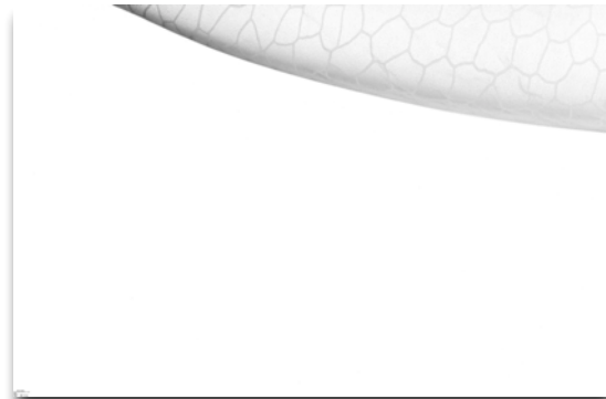
Unbekanntes (großes) Objekt in 1000m Wassertiefe (20 cm Bildbreite).