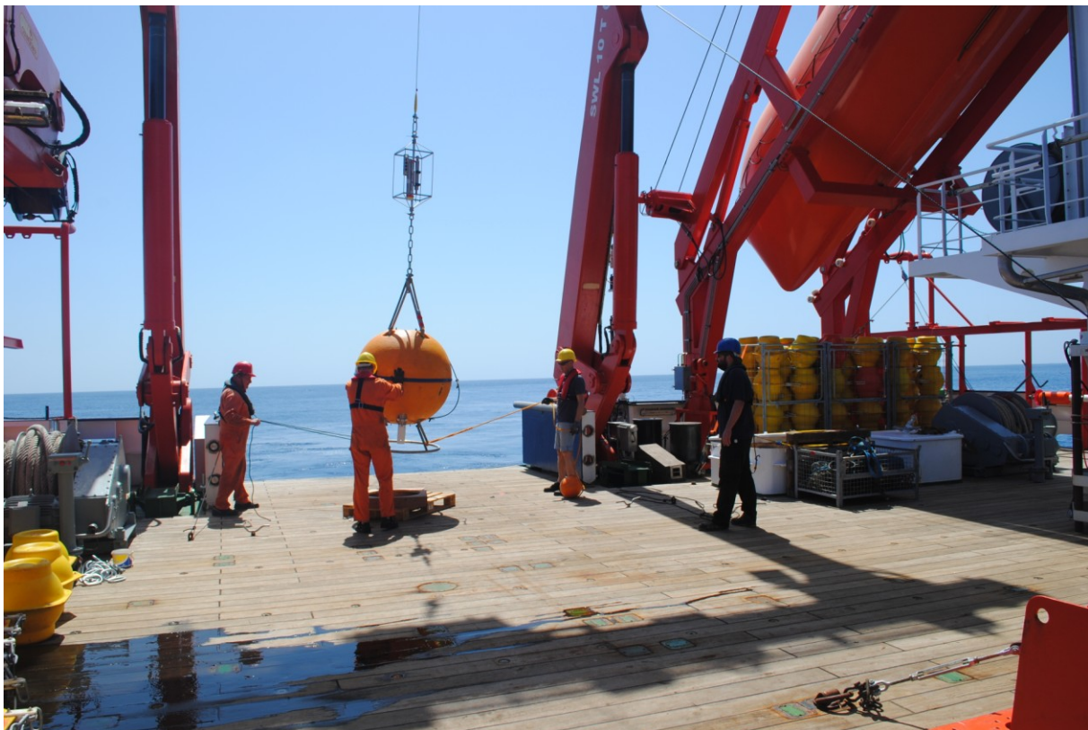
Abb. 1: Auslegung des Kopfelements einer Verankerung am südlichen Rand der Sauerstoffminimumzone. Gut zu erkennen ist der Instrumentenkäfig (oberhalb der Auftriebskugel) zum Schutz der Sauerstoff-, Temperatur- und Salzgehaltssensoren.

In der zweiten Phase des SFB754 wurde ein Verankerungsarray bewilligt, das genau diese verschiedenen Prozesse untersuchen soll. Dabei werden die zeitlich hochaufgelösten Messungen an den Verankerungspositionen durch den Einsatz eines Gleiterschwarms unterstützt. Drei autonome Gleiter wurden an den Verankerungspositionen ausgelegt. Sie sollen während des nächsten MERIAN Fahrtabschnitts von Prof. Martin Visbeck wieder eingesammelt werden. Die Gleiter sollen zwischen den Verankerungen die räumliche Variabilität der Sauerstoffverteilung erfassen. Einer der Gleiter ist zudem mit einer Mikrostruktursonde ausgerüstet, die es ermöglicht, die vertikale Vermischung in den oberen 900 m des Ozeans zu bestimmen. Damit kann zusätzlich die Sauerstoffzufuhr zur Sauerstoffminimumzone von oben und unten bestimmt werden. Ziel ist es letztendlich die gesamte physikalische Sauerstoffzufuhr zu den Sauerstoffminimumzonen besser zu quantifizieren und die notwendige Datenbasis für die Verbesserung physikalisch-biogeochemischer Modelle zu schaffen. Die Aktivitäten des Gleiterschwarms können in Echtzeit auf http://gliderweb.geomar.de/html/swarm03.html beobachtet werden.