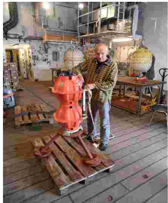
Vorbereitung eines Bodensensors im Hangar der Merian

Nach Vermessung von Hydrographie und Strömungen entlang eines Schnittes von der Küste in die zentrale Labrador See machten wir uns wieder nach Südosten auf. Die erfolgreiche Installation der Bodensensoren im Norden erlaubte es nun deren Gegenpaare bei 53°N zu installieren. Das geschah am Freitag und nun arbeiten wir uns langsam, von Station zu Station, einen Weg zum Arbeitsgebiet östlich von Grönland. Draußen herrscht heute, am Pfingstsonntag, dichter Nebel bei immerhin 6 Grad Lufttemperatur. Von den sommerlichen Temperaturen die von Zuhause gemeldet werden ist hier also wenig zu spüren. Dennoch hat Hoch „Otto“ auch uns was zu bieten – dadurch das Otto sich Richtung Island verlagert hat lenkt es die Tiefdruckgebiete auf Kursen die südlich von uns verlaufen und beschert uns zur Zeit eine eher ruhige See.