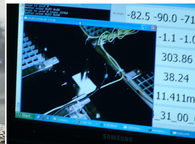
Abbildung 1: Test der neuen elektromagnetischen Quelle Sputnik vor Beginn des Transits nach Brasilien.

In dieser Woche wurden nur noch am 6. und 7. Februar aktive Experimente gefahren. Zum einen haben wir die Kartierung des Meeresbodens von Tristan da Cunha bis hin zum mittelatlantischen Rücken beendet. Ziel der Kartierung ist die Suche nach vulkanischen Strukturen, die ein Indiz einer möglichen sublithosphärischen Verbindung des Hotspots mit dem Rücken liefern könnte. Die Kartierung wurde entlang der ost-west-streichenden Tristan-Fracturezone, welche den Tristan da Cunha Komplex mit dem mittelatlantischen Rücken verbindet, ausgeführt. Während der Kartierung überquerten wir mehrmals die Tristan-Fracturezone, fanden jedoch keine direkten Anzeichen vulkanischer Strukturen. Unsere Kartierung endete wo die Fracturezone auf den mittelozeanischen Rücken trifft und wo sich ein ca. 5000 m tiefen Nodalbecken entwickelt hat. Direkt süd-westlich des Beckens kartieren wir einen 3 nm x 3 nm sogenannten core-complex, d.h. einen aus der unteren Kruste aufgeworfenen Gesteinskomplex aus Gabbro und Peridotit. Die bathymetrische Kartierung endete am 7.2. um 15:10.