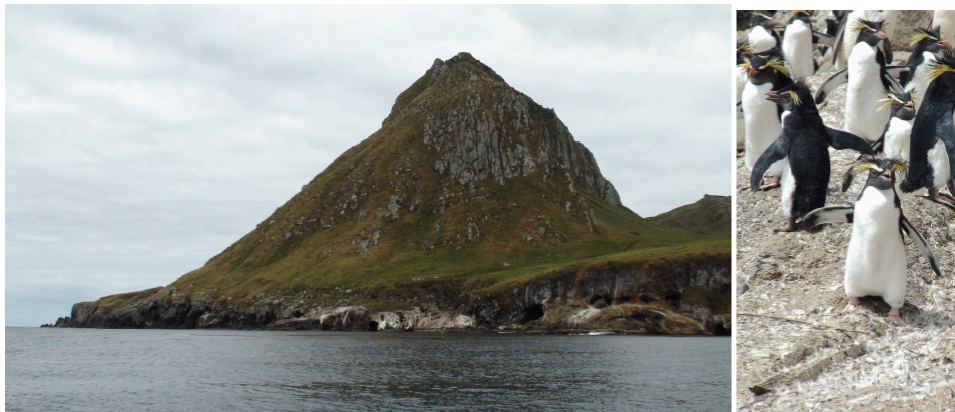
Abbildung 1: Die Insel Nightingale und eine Gruppe ihrer Rockhopper Pinguin Bewohner.