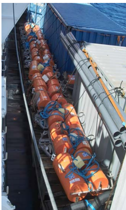
Abbildung 1: OBS in Vorbereitung

In der zweiten Woche der Ausfahrt MSM04/2 wurde die aktive Seismik planmässig abgeschlossen. Am Montag, den 08.01 wurde das letzte der 50 ausgelegten Ozeanboden-seismometer (OBS) geborgen. Die Daten sind alle von guter bis sehr guter Qualität, die Reichweiten liegen über 150 km. Im Bereich des Akkretionsrückens ist die Eindringung und Reichweite allerdings deutlich geringer.