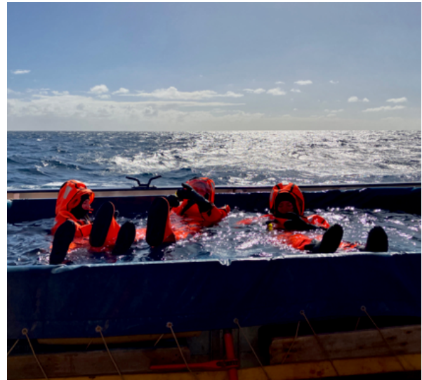
Abb. 1: Überlebensanzüge werden im Wasserbecken ausprobiert.

Das wissenschaftliche Programm dieser Woche bestand hauptsächlich aus dem Einsatz von Oberflächendriftern und Glidern sowie einer CTD-Dauerstation. Während des Transits haben wir die Entwicklung der Wirbel im Arbeitsgebiet anhand von Satellitenaltimeterdaten verfolgt und eine Position im Zentrum eines antizyklonalen Wirbels zum Aussetzen von Glidern und Driftern ausgewählt.